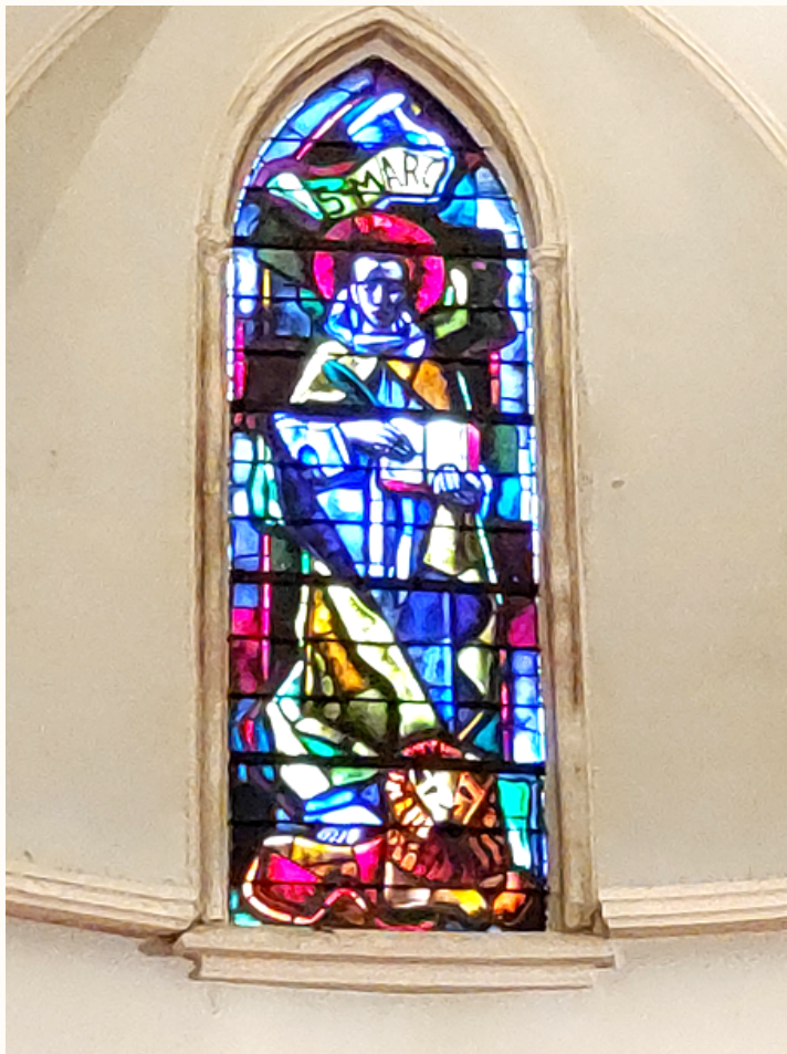
VITRAIL DE L'ÉGLISE DE ST MARC